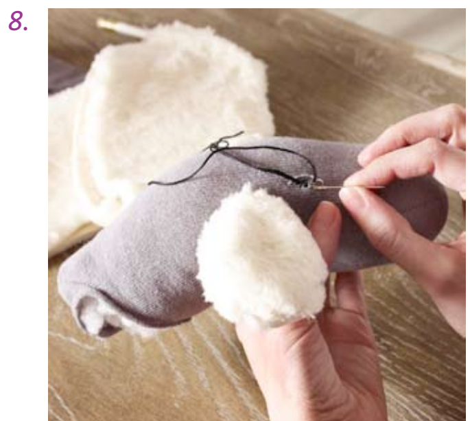
Augen und Nase mit Sticktwist aufnähen. Kopfteil mit einigen Stichen unten zunähen, damit die Füllwatte nicht herausfällt..