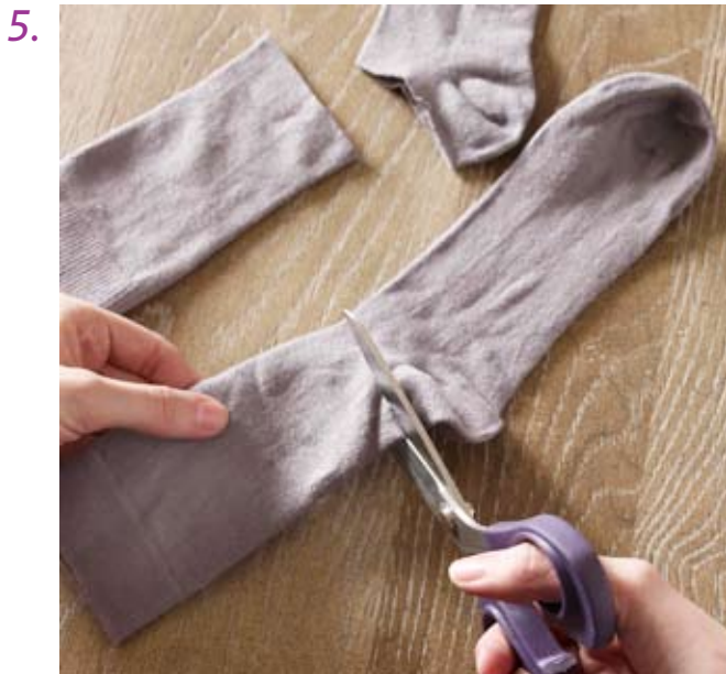
Kopfteil nach Vorlage aus einer Socke zuschneiden.