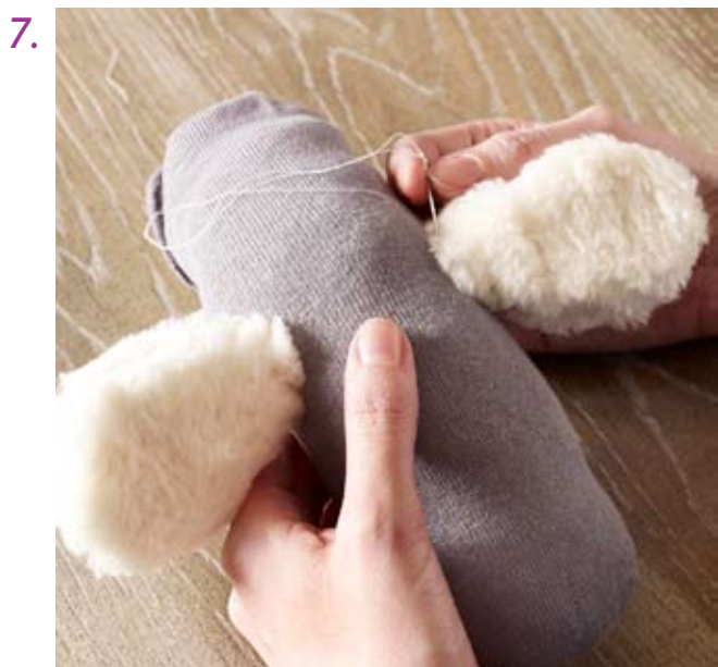
Ohren per Hand an den Kopf nähen.